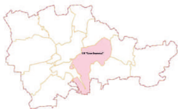
Схема расположения сельского поселения "Село Бережки" Кировского района